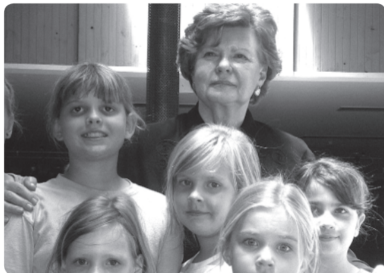
Vaira Viķe-Freiberga ar 3x3 jauno paaudzi 2009. gada Austrālijas saietā Vomarū

vienādas, bet, lai cik atšķirīgas tās arī nebūtu dažādās vietās un laikos, tās vienmēr ir bijušas atpazīstamas –