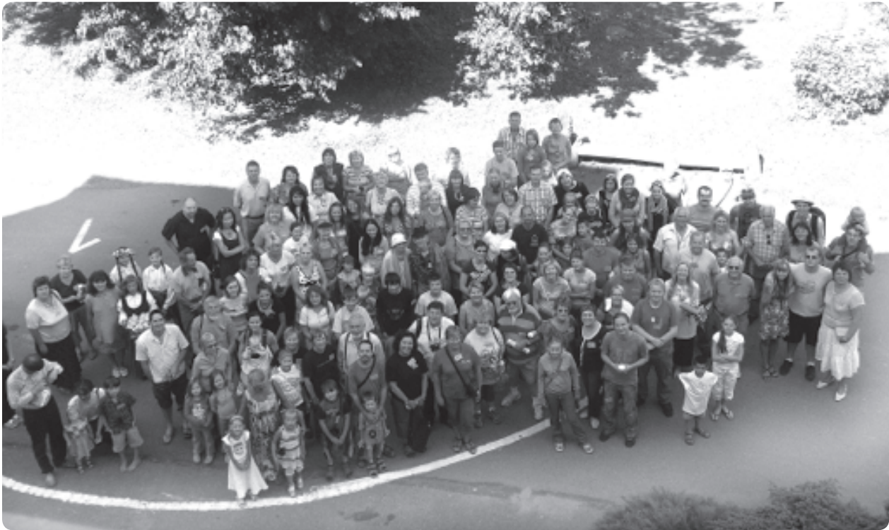
3x3 Vadības loku nometnes kopbilde, 2008