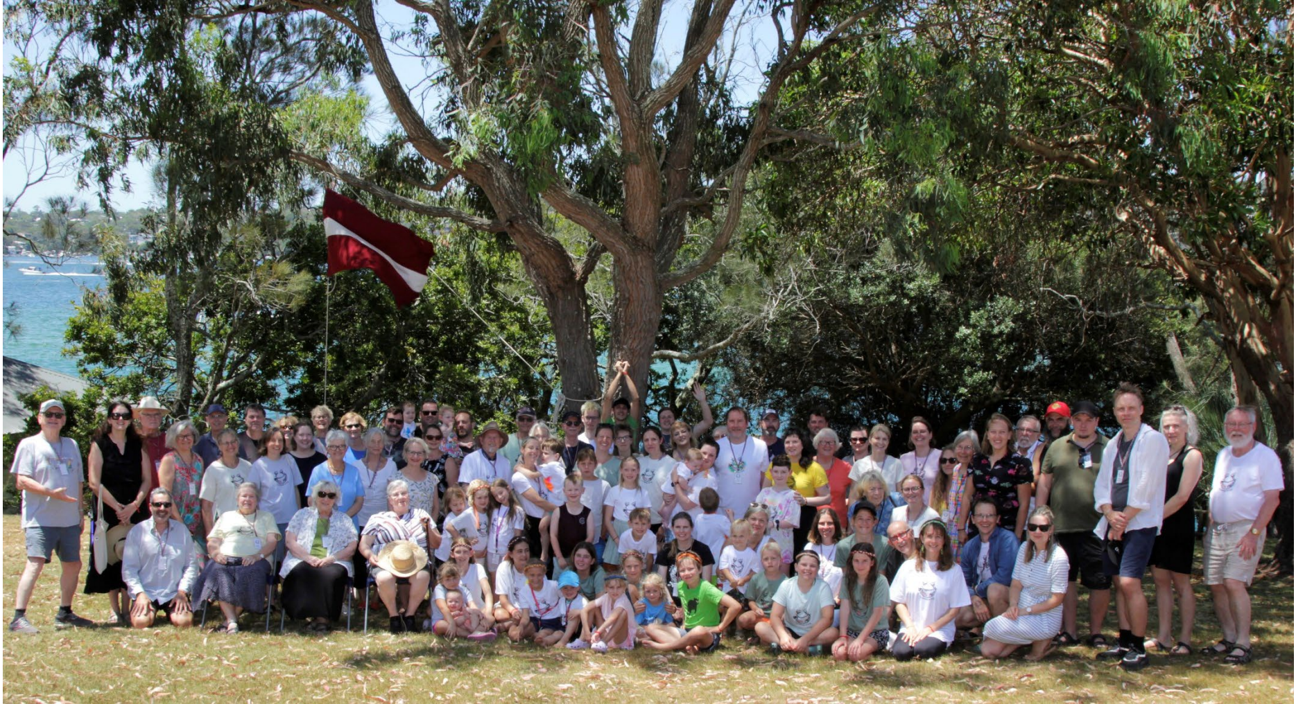
3 x 3 Sidnejā 2025.g. Rathane