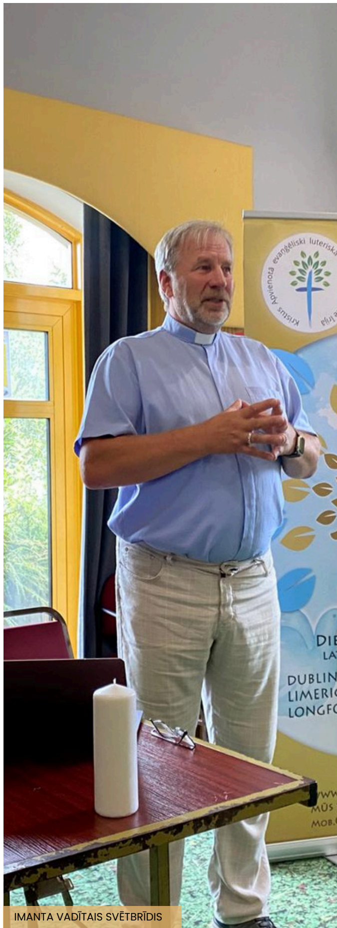
IMANTA VADĪTAIS SVĒTBRĪDIS

Ikdienišķais saieta ritējums mūs iepriecina, satuvina vienu ar otru un liek pamanīt to, ka, lai gan esam tik ļoti dažādi,, mēs esam vienoti savās izjūtās, pat ja noskaņas un emociju izpausmes atšķiras.