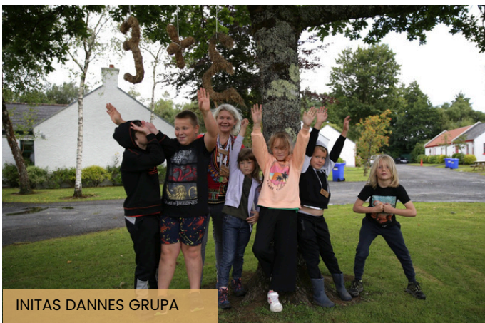
INITAS DANNES GRUPA