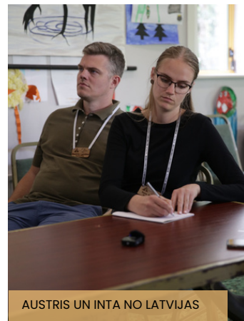
AUSTRIS UN INTA NO LATVIJAS