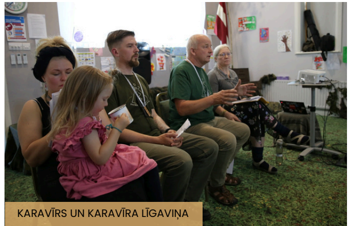
KARAVĪRS UN KARAVĪRA LĪGAVIŅA