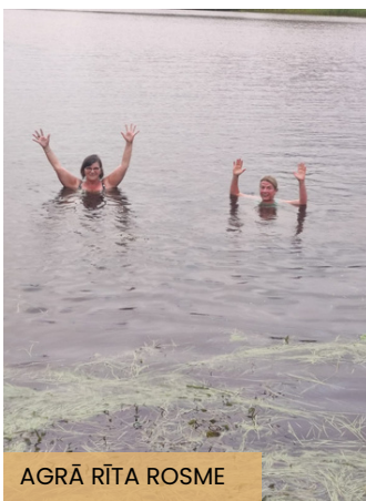
AGRĀ RĪTA ROSME