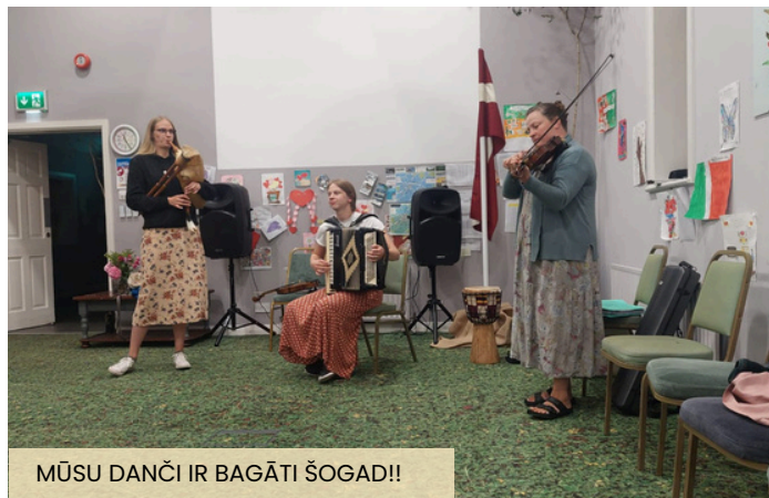
MŪSU DANČI IR BAGĀTI ŠOGAD!!