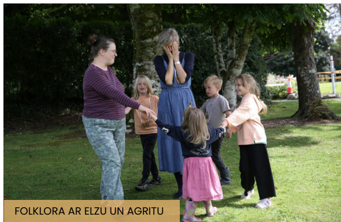
FOLKLORA AR ELZU UN AGRITU