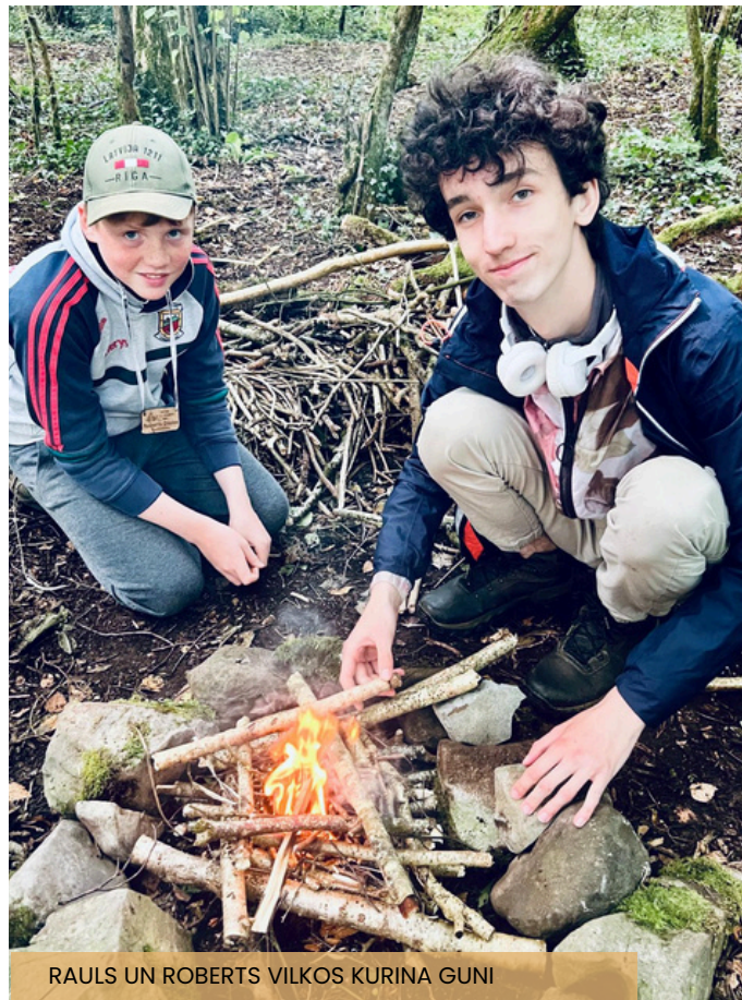
RAULS UN ROBERTS VILKOS KURINA GUNI