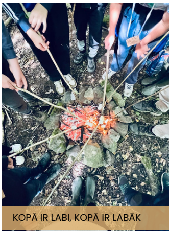
KOPĀ IR LABI, KOPĀ IR LABĀK