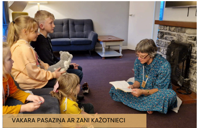
VAKARA PASAŽIŅA AR ZANI KAŽOTNIECI