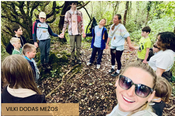
VILKI DODAS MEŽOS

Lielu ieguvēji 3x3 saietos ir bērni, kurus vecāki atved, parasti ar klusu vai izteiktāku cerību, ka viņi šeit sastaps mīļus draugus. Šogad esam redzējuši, kā tiek turpinātas iesāktās draudzības un iesāktas jaunas. Tas ir patiesi skaisti un vērtīgi.