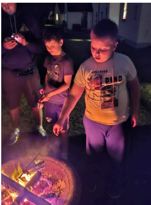
Kur puīši top par vīriem un tēviem?