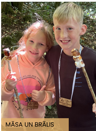
MĀSA UN BRĀĻIS