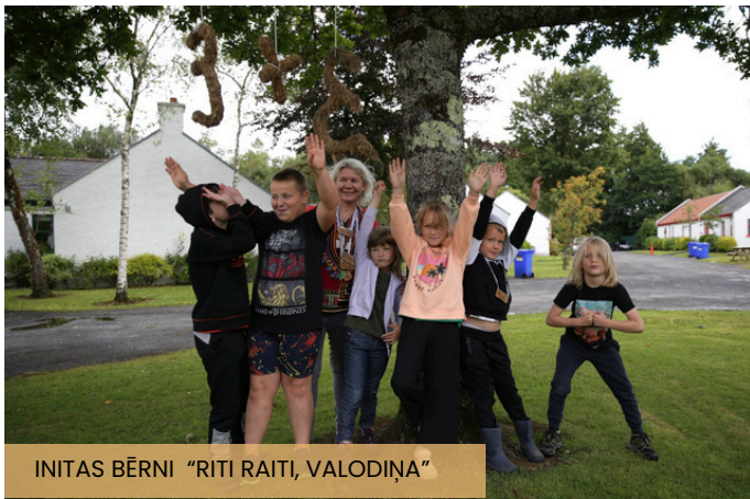
INITAS BĒRNI "RITI RAITI, VALODIŅA"