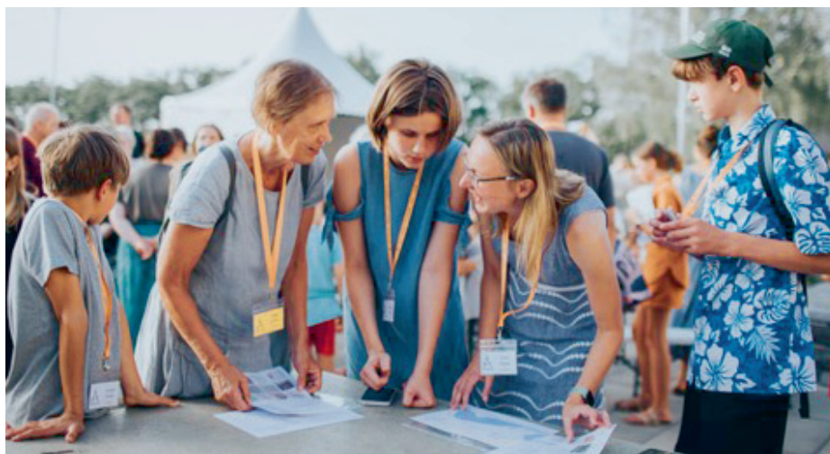
Iepazīšanās vakars apvienojumā ar orientēšanos.