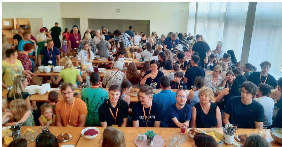
Mazu brīdi pirms pirmajām pusdienām. Veģetārieši Kokneses 3x3 saietā ēd uz skatuves.