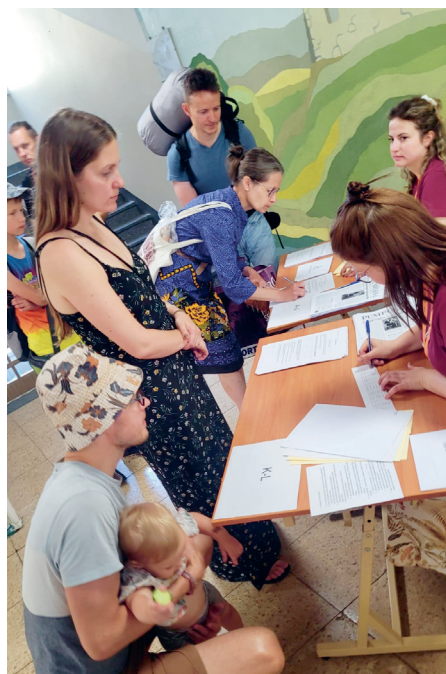
Sanākušie reģistrējas, vārda kartes šoreiz katram noliktas guļasvietā.