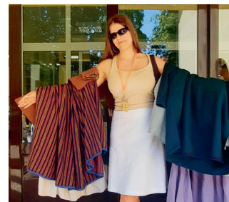
Uz saietu cits nāk vizēm, cits basām kājām, bet dažas dāmas ved līdzī veselu skapi.