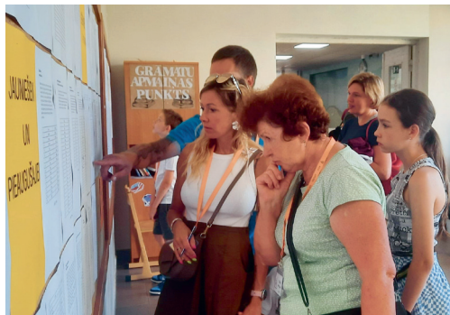
Ieviržu saraksti gari un plaši, vēl var pagūt pieteikties tām, kas pabrīvas.