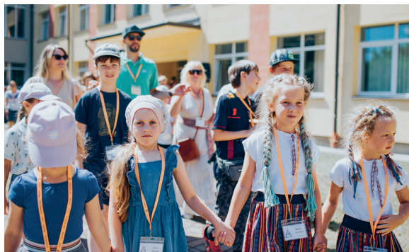
Saieta atklāšanas goda solī.