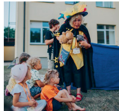
Pirmā vakara pasaciņa.