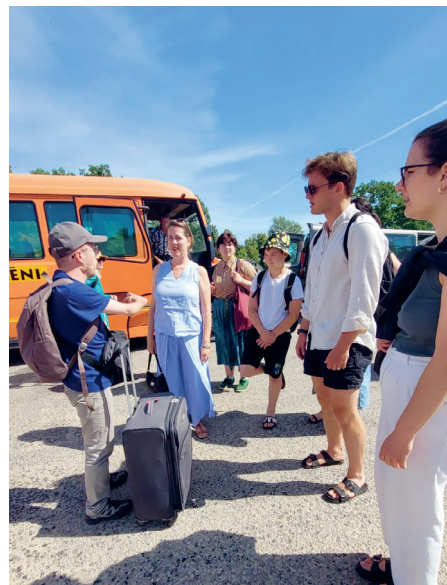
No vilciena uz autobusu un tad – uz skolu.