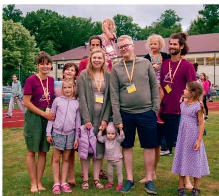
Foto ar saietā vadītājiem.