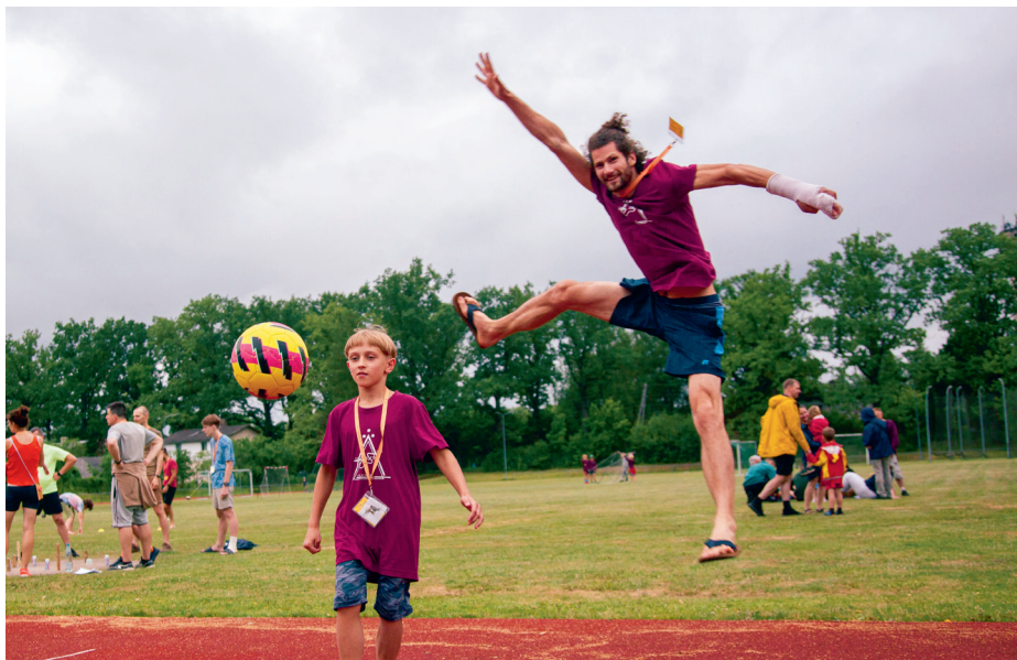
Uh, kas par lēcieni!