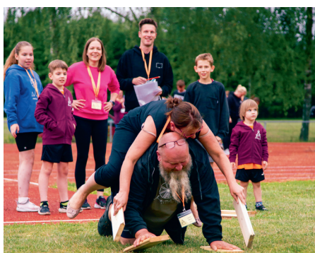
Pērses upes šķērsošana.