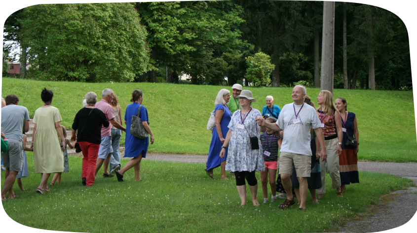
Ar goda soli iestaigājam Limbažu 3x3 paceltā karoga laukumu.