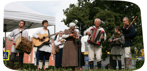
Folkloras kopa "Putni" iečivināja un pamatīgi iebungoja kā saieta atklāšanu, tā arī iepazīšanās ar ieviržu vadītājiem vakaru.